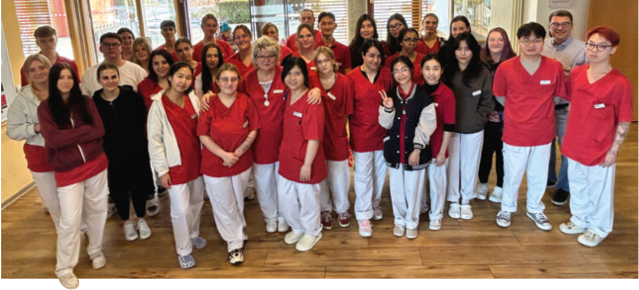
oben: Gruppenfoto der Auszubildenden.